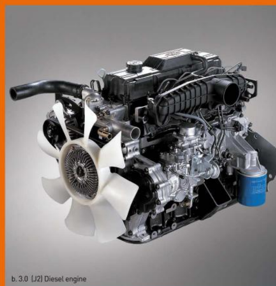
b. 3.0 (J2) Diesel engine